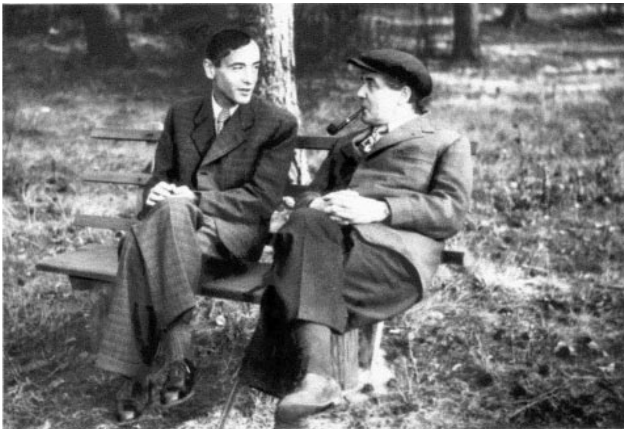
П.Л. Капица и Л.Д. Ландау на Николиной Горе, 1948 г. Л.Д. Ландау был одним из немногих, кто не боялся посещать Петра Леонидовича на Николиной Горе в его опальные годы

Резерфорд активно поддерживал работы П.Л. Капицы в новом направлении и добился крупных субсидий и строительства нового здания. В результате этого в Кембридже была построена специальная лаборатория им. Монда Лондонского Королевского общества для проведения исследований в сильных магнитных полях и при низких температурах. Директором этой лаборатории был назначен П.Л. Капица. Первый гелиевый оживитель Петр Леонидович построил в этой лаборатории.